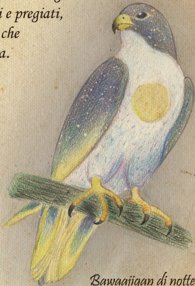
Bawaajigan di notte

Animale straordinariamente intelligente e dal temperamento mite, ha un forte senso di indipendenza che fa sì che solo i