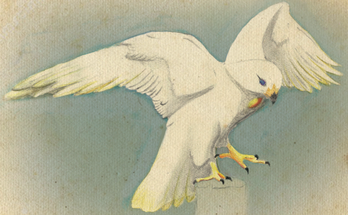
Bawaajigan di giorno

Il piumaggio è mutevole: di giorno è facile confonderlo con un comune girifalco (si differenzia da esso solo per la presenza di alcune penne remiganti dorate e un disegno circolare del medesimo colore all'altezza del petto), mentre di notte il suo piumaggio muta, le piume bianche cambiano colore fino a ricordare un cielo stellato e le piume dorate tendono alle tonalità della luna. Estremamente abile nella caccia, si nutre principalmente di roditori, piccoli uccelli e serpenti.